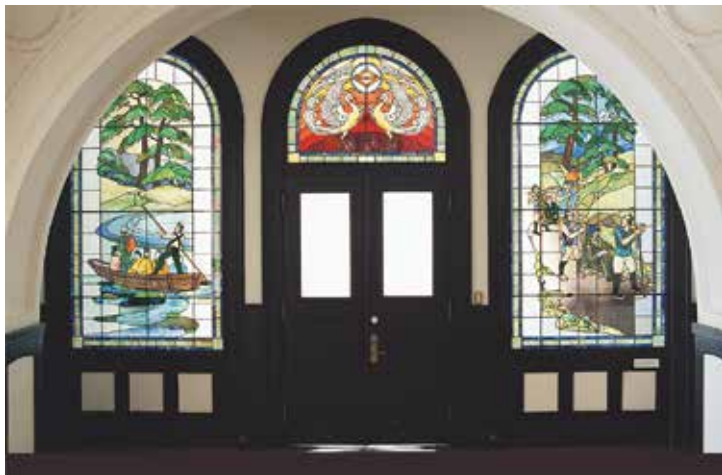
二楼大厅的彩色玻璃窗（吴越同舟 / 凤凰 / 越过箱根）

开港纪念馆的钟楼被称为‘Jack’，与神奈川県厅本馆的‘King’和横滨税关的‘Queen’一起，被亲切地称为横滨三塔。